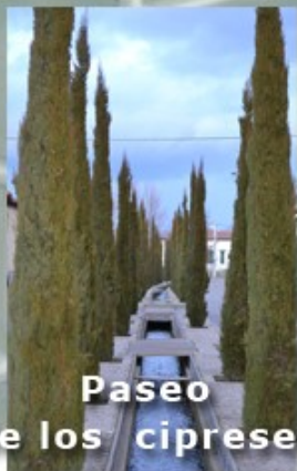
Paseo de los cipreses