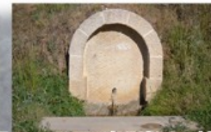
Fuente de la villa