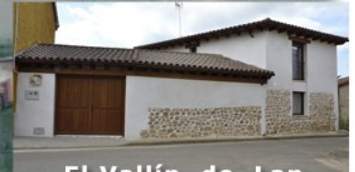
El Vallín de Lan