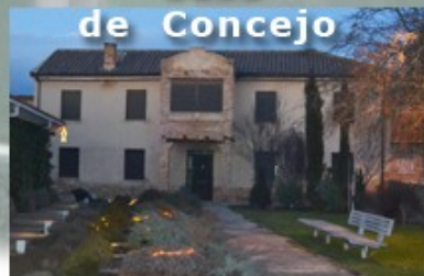
Casa de Concejo