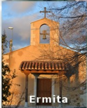
Ermita Sto Cristo