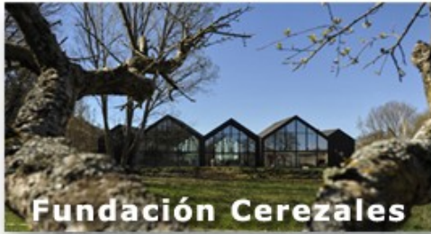
Fundación Cerezales Antonino y Cinia